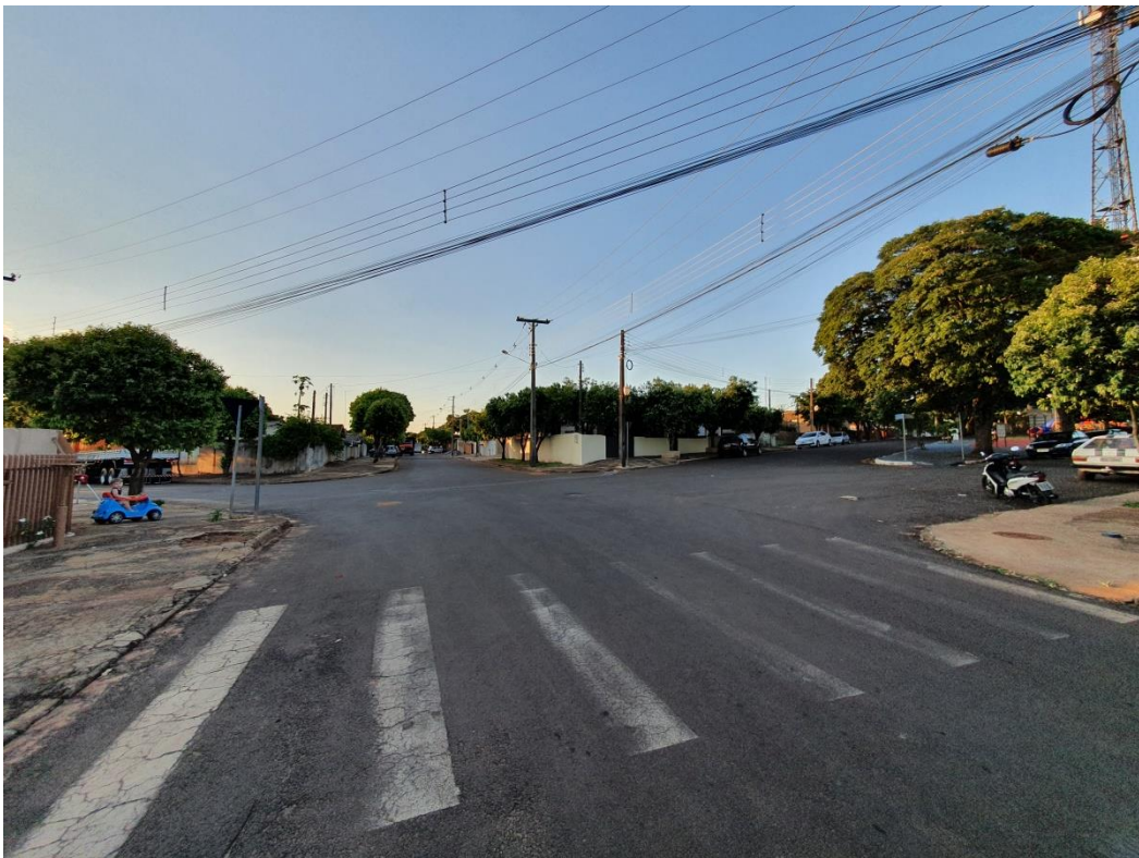
Figura 02 – Foto do cruzamento em questão, vista da Rua Venceslau Brás de quem vem da Av. Melvin Jones.