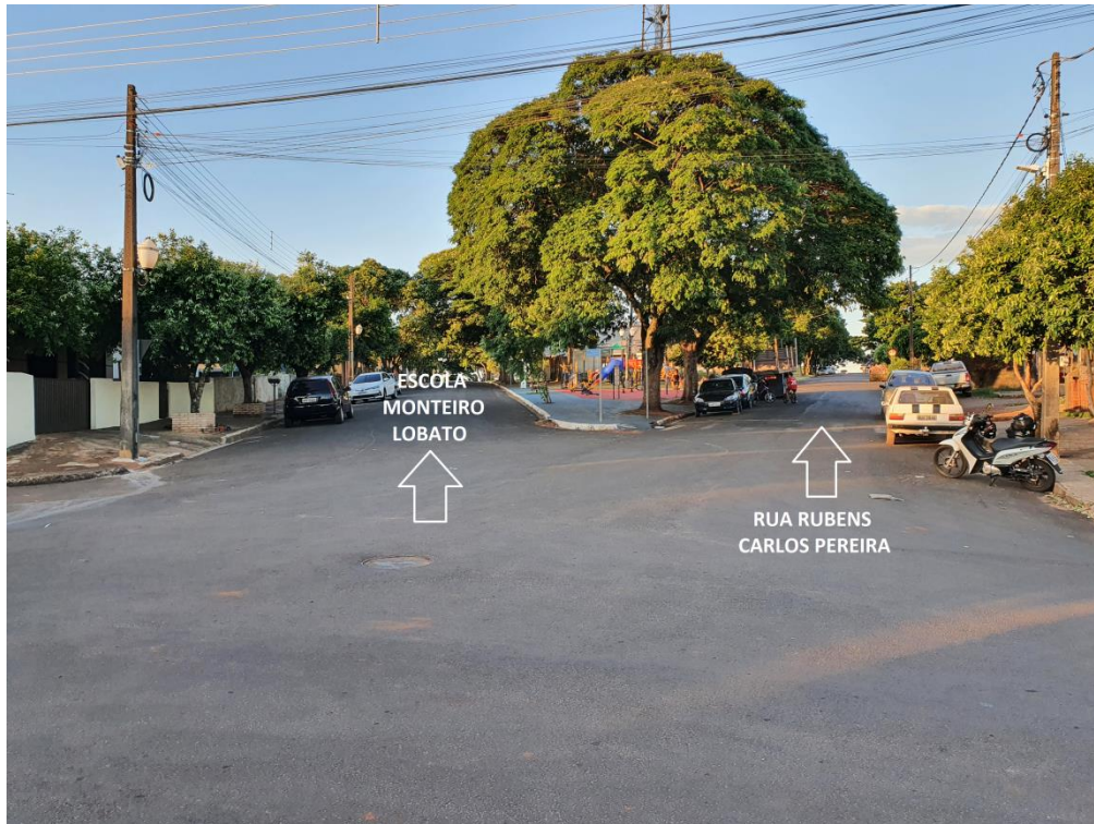
Figura 03 – Vista da Rua Professor Luis Palazi Pereira (Escola Monteiro Lobato) e a Rua Rubens Carlos Pereira.